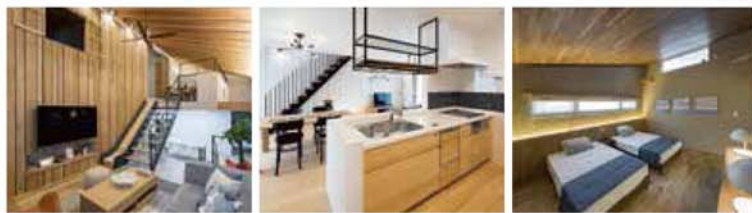
※画像は弊社施工例です。

建物は自由設計（フリープラン）です。 ご希望をお聞きし、仕様・プランをご提案させていただきます。 東匠建設のつくる家は自然素材を積極的に用いた「気ごちのいい家」。 思わず深呼吸したくなるような心地よさ、安全の東匠クオリティをぜひ 稲沢モデルハウスで体感してみてください。